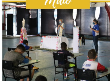
MISSA DE NOSSA SENHORA AUXILIADORA