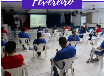
FORMAÇÃO EDUCADORES E FUNCIONÁRIOS