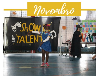
SHOW DE TALENTOS