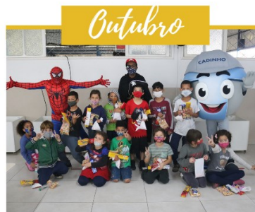
FESTA DIA DAS CRIANÇAS