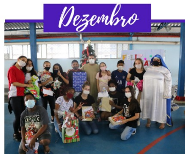
FESTA DE NATAL