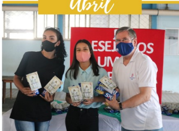
ENTREGA DE CHOCOLATES P/ JOVENS