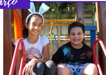
CAMPANHA DE PÁSCOA