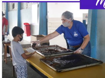
PDB 60 ANOS