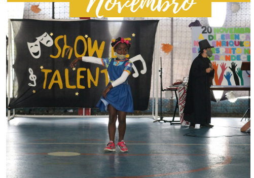
SHOW DE TALENTOS