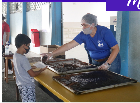
PDB 60 ANOS