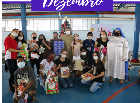
FESTA DE NATAL