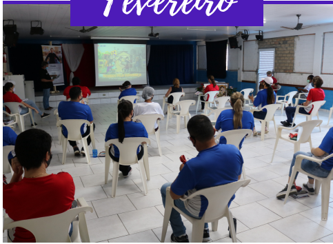
FORMAÇÃO EDUCADORES E FUNCIONÁRIOS