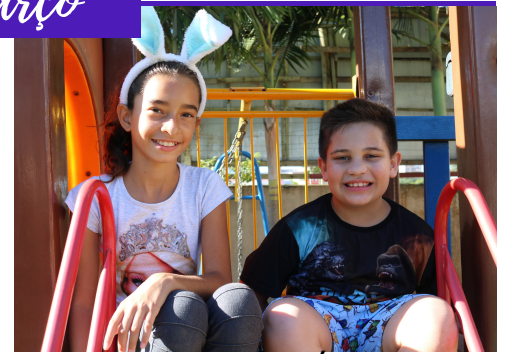
CAMPANHA DE PÁSCOA