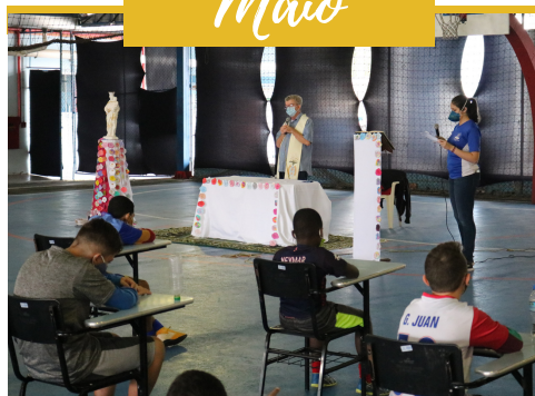
MISSA DE NOSSA SENHORA AUXILIADORA