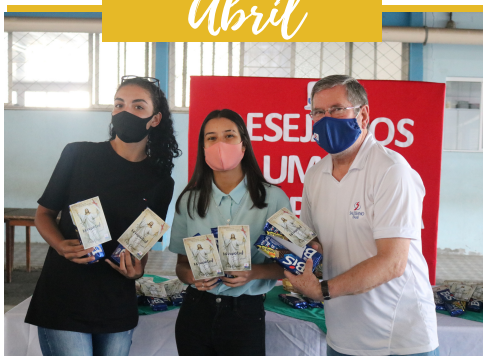
ENTREGA DE CHOCOLATES P/ JOVENS