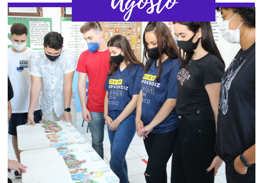
GINCANA DOM BOSCO